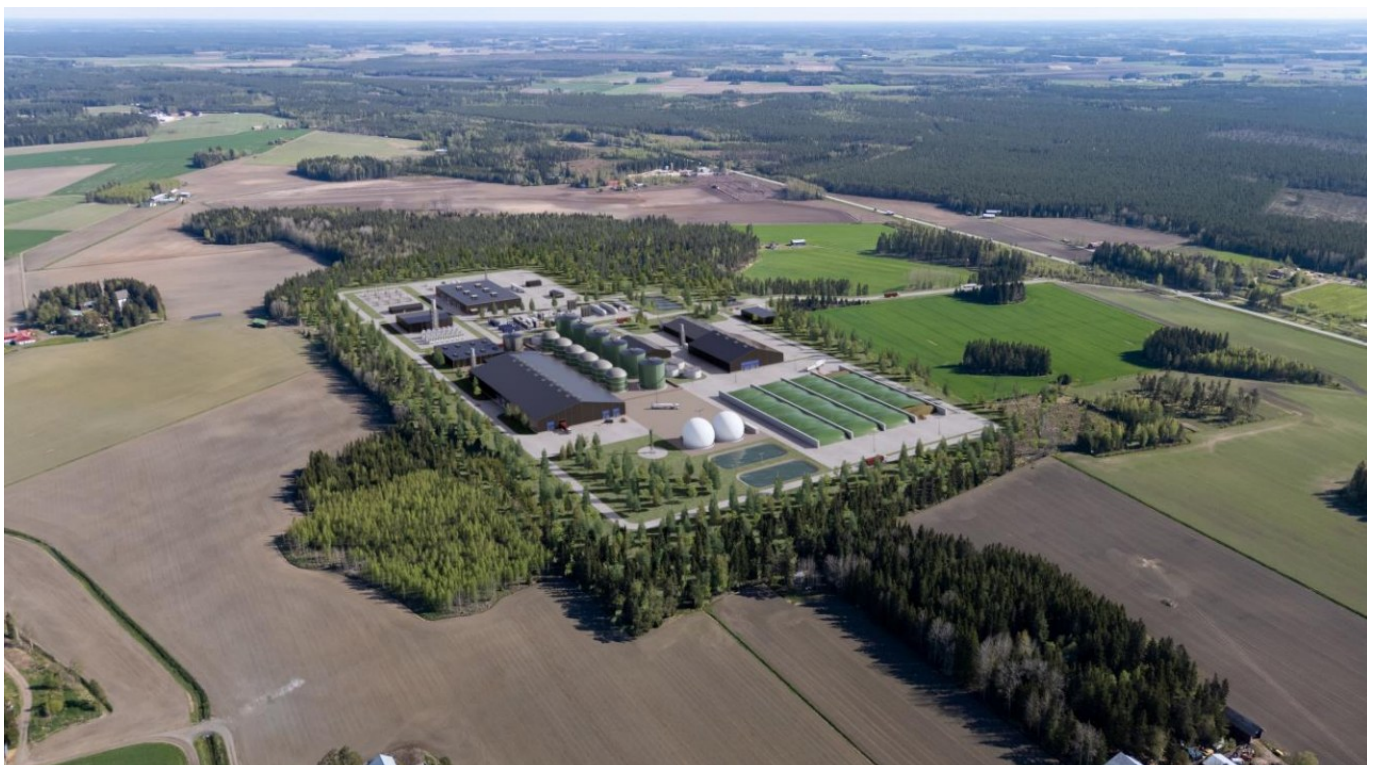
Havainnekuva biokaasulaitoksen alueesta (kuva: Wega Group Oy).

Wega Group Oy on avannut oman nettisivun Varsinais-Suomen biojalostamolle. Voit tutustua hankkeeseen ja sen etenemiseen biojalostamon omilla nettisivuilla https://biojalostamo.fi/