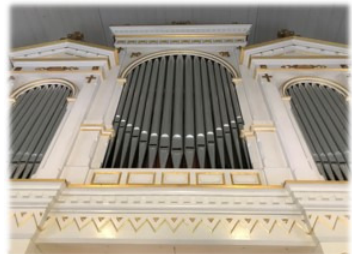
Yläneen kirkon urkujen fasadi

kahden vartin musiikkituokiot Pöytyän seurakunnan kirkkoalueilla kesä-elokuussa. Tarkemmat ajat Kirkollisissa ja Facebookissa sekä seurakunnan nettisivuilla.