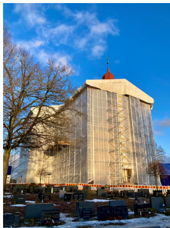
Paketoitu Pöytyän kirkko

peruskorjaushanke on alkanut 18.1.2024. Hanke sisältää katto- ja julkisivukorjauksen, ikkunoiden kunnostuksen sekä hirsiseiniä suoristuksen. Hankkeen aikana kirkko on poissa käytöstä syyskuun loppuun saakka. Korjaustyön aikana kirkonkelloja ei soiteta. Kirkkoalueen hautaukset toimitetaan joko haudalla tai jossakin toisessa seurakunnan kirkossa. Hankkeen etenemistä voi seurata seurakunnan nettisivuilla Päätöksenteko -välilehden alla, jonne päivitetään työvaiheilmoituksia ja kuvia.