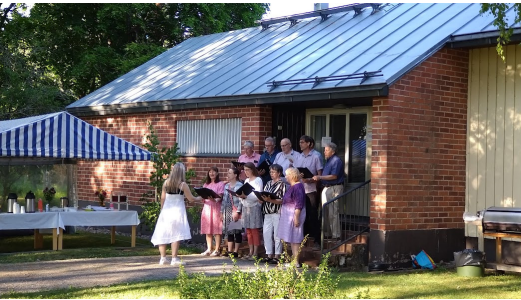
Pöytyän kirkkokuoro seurakuntatoimiston edustalla juhannusaattona

klo 18 Yläneen Rantapappilassa Pyhäjärven rannalla