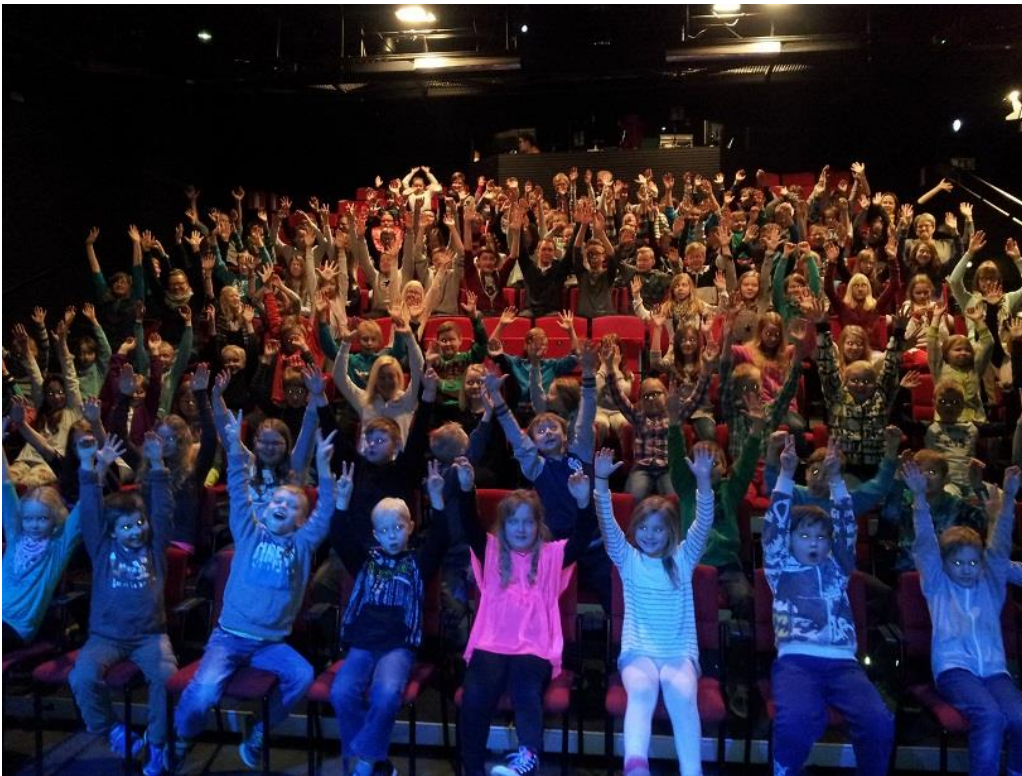
LC Oripään matkassa Rauman kaupunginteatterissa, hetki ennen esitystä